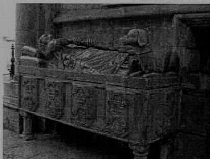
Imagem A – Túmulo de Lopo Pacheco (Sé de Lisboa)

1. Observe as imagens A e B com atenção: